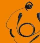
Взрывозащищенная гарнитура с регулируемой длиной провода EHN12-Ex