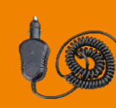
Автомобильное зарядное устройство CHV09