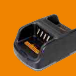
Двухсекционное зарядное устройство (только для работы в безопасной зоне) CH10A06