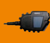
Взрывозащищенная клавиша PTT SM24N2-Ex*