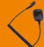
Взрывозащищенный удаленный микрофон (IP67) SM18N8-Ex