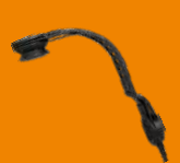
Гарнитура с костным преобразователем звука (RoHS) POA34-Ex*

Hytera PT790 Ex разработана с улучшенной технологией обработки голоса, что позволяет подавлять воздействие шумной обстановки (внешние шумы) и эффект эха (акустического эха). Это обеспечивает пользователям качественную связь даже в шумной среде, а также улучшенные характеристики при использовании громкой связи во время дуплексного вызова.