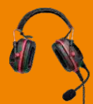
Гарнитура с шумоподавлением (RoHS) POA62-Ex*