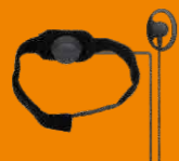
Гарнитура ларингофонная (RoHS) POA61-Ex*