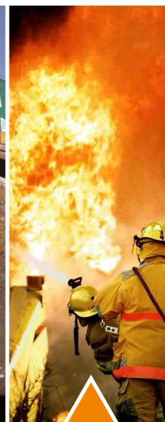
Пожарные и спасательные службы

Горнодобывающая промышленность – очень сложная отрасль, работы в которой постоянно и длительно ведутся в присутствии взрывоопасных смесей газа и пыли. В особенности это касается метана в угольных шахтах, когда образуется исключительно опасная среда. В этих условиях особое значение имеет эффективная и безопасная связь. Радиостанции Hytera PT790 Ex с типом взрывозащиты «ia» соответствуют всем этим требованиям.